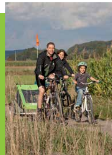
LE GAL ROMANÉ C'EST POUR VOUS & AVEC VOUS !