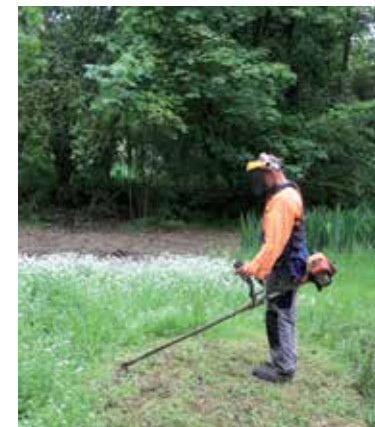
ENTRETIEN DES VOIES LENTES

Des formations à l'attention des ouvriers communaux du territoire sont organisées au fil des saisons, pour assurer un entretien des voies cyclables et pédestres, en pleine osmose avec la nature, vive la gestion différenciée !